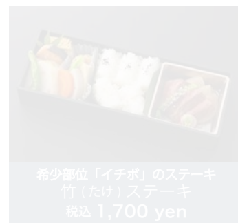
希少部位「イチボ」のステーキ 竹(たけ)ステーキ 税込 1,700 yen