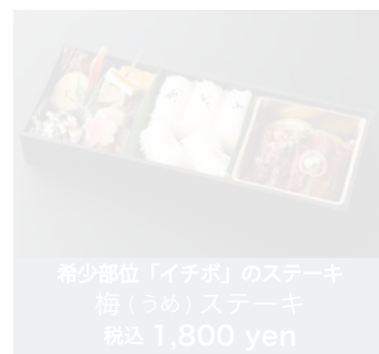
希少部位「イチボ」のステーキ 梅(うめ)ステーキ 税込 1,800 yen