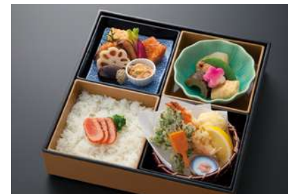
旬彩 (しゅんさい) 税抜 1,500 yen

鰯照焼 / 大玉子焼 / 根角味噌煮 / 鴨コース / 五目豆腐揚煮 / 浅瀬生姜煮 / 鮪 / 露の薑天 / 蓮根にぎり揚 / 菜花白扇揚 / なま酢 / 公魚南蛮漬 / 白ご飯 / 蟹真薯 など