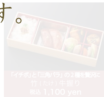
「イチボ」と「三角バラ」の2種を贅沢に 竹(たけ)牛握り 税込 1,100 yen