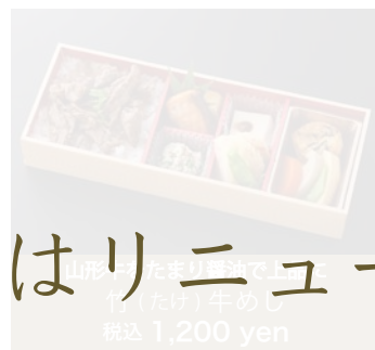
山形牛100% 竹(たけ)牛めし 税込 1,200 yen