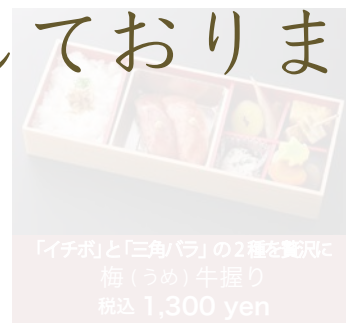
「イチボ」と「三角バラ」の2種を贅沢に 梅(うめ)牛握り 税込 1,300 yen