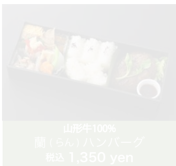
山形牛100% 蘭(らん)ハンバーグ 税込 1,350 yen