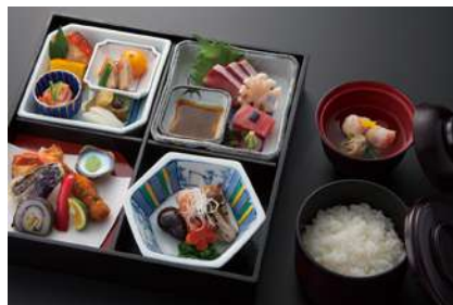
舞楽 (ぶがく) 税抜 2,500 yen

河豚一夜干しろう焼 / 海老芋芥子揚 / 瓢箪玉子 / サーモン年輪巻 子持ち鮎 / 牛小春煮 / 穴子八幡巻 / 酢橘釜 あん肝 / ほうぼう花造り / 細魚 / 金目鯛蕪蒸し / 松笠くわい揚煮 / 白ご飯 / ずわい蟹葛打ち など