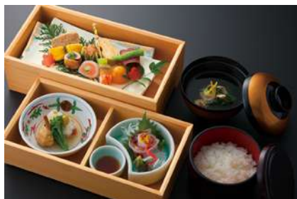
神楽 (かぐら) 税抜 3,000 yen

河豚一夜干しろう焼 / 海老芋芥子揚 / 瓢箪玉子 / サーモン年輪巻 子持ち鮎 / 牛小春煮 / 穴子八幡巻 / 酢橘釜 あん肝 / ほうぼう花造り / 細魚 / 金目鯛蕪蒸し / 松笠くわい揚煮 / 白ご飯 / ずわい蟹葛打ち など