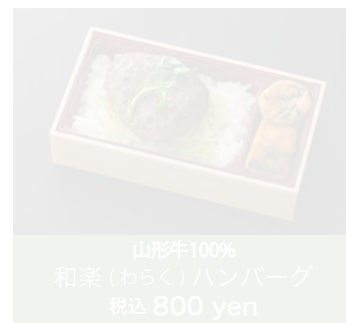
山形牛100% 和楽(わらく)ハンバーグ 税込 800 yen