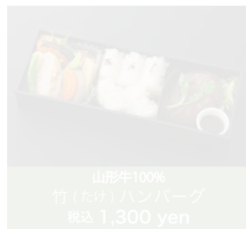
山形牛100% 竹(たけ)ハンバーグ 税込 1,300 yen