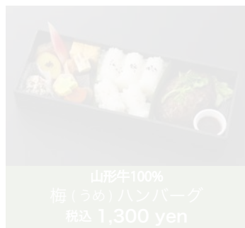
山形牛100% 梅(うめ)ハンバーグ 税込 1,300 yen