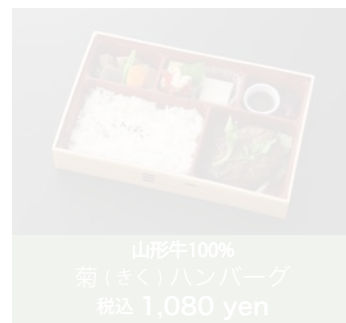
山形牛100% 菊(きく)ハンバーグ 税込 1,080 yen