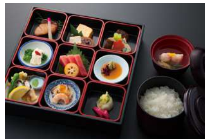
風雅 (ふうが) 税抜 2,000 yen

金目鯛味噌庵焼 / 南瓜カステラ / みぞれ酢和え / 浅瀬時雨煮とろろ掛け / 山形牛ローストビーフ / 白菜サラダ / 天蕪・海老芋味噌そばろ餡掛け / 穴子黄味煮 / 河豚唐揚 / 茄子天 / 里芋鳴門揚 / 海老紫蘇パン粉揚 / 白ご飯 / 蟹真薯 など