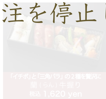
「イチボ」と「三角バラ」の2種を贅沢に 蘭(らん)牛握り 税込 1,620 yen

「山形牛」と冠される の山形牛が、 橋膳のメニューに加わりました。 【春と昼夜の大きな寒暖の差が育む 繊細やかな肉質と、旨味の詰まった 上質な脂質。】