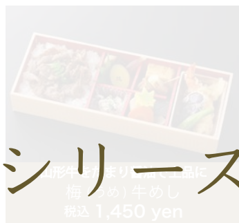
山形牛100% 梅(うめ)牛めし 税込 1,450 yen