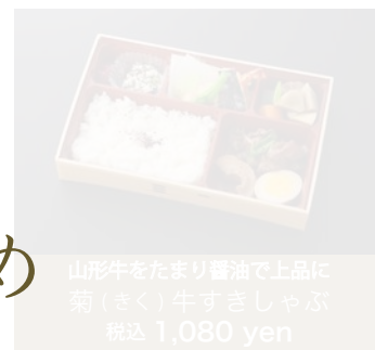
山形牛をたまり醤油で上品に 菊(きく)牛すきしゃぶ 税込 1,080 yen