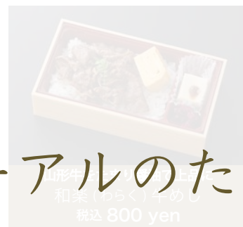
山形牛100% 和楽(わらく)牛めし 税込 800 yen