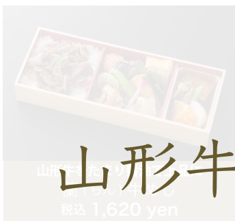
山形牛100% 和楽(わらく)ハンバーグ 税込 1,620 yen